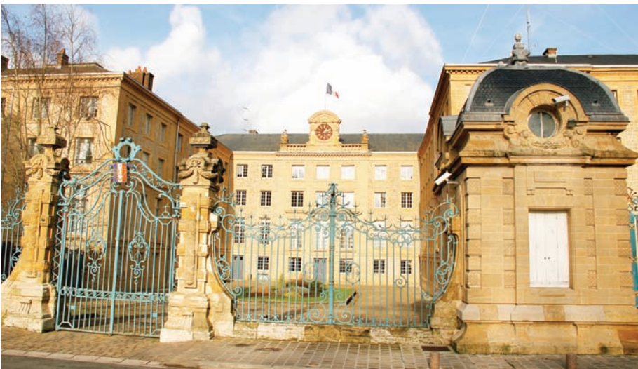
Illustration 4 : l'École du génie de Mézières

Photographie du colonel Dardonville (1948) de la porte d'Arches qui abrite l'École du génie entre 1748 et 1753, puis sert à divers enseignements en annexe de l'Hôtel du Gouvernement puis de la nouvelle école de 1753 à 1793 (BCXRH, X2b/443 : Colonel Dardonville, L'école royale du génie de Mézières, 1748-1948 , fascicule).