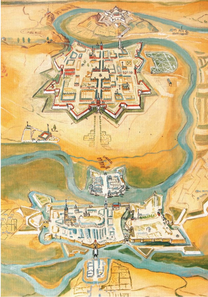
Illustration. 1 - Charleville, Mézières et leurs environs à la fin du XVII e siècle

aux questions spatiales invite l'historien d'un groupe élitare à interroger l'espace sur lequel la domination symbolique ou réelle du groupe s'appuie et se diffuse 19 .