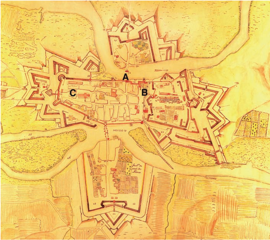
Illustration 2 : plan de Mézières (1748)

Mézières, 1748, 1ère feuille. Dupont (copie Erker), 1747 (copie 1948), 395 x 605mm (435x650/475x615mm), couleurs, 150 toises, AD Ardennes 1 fi 610.